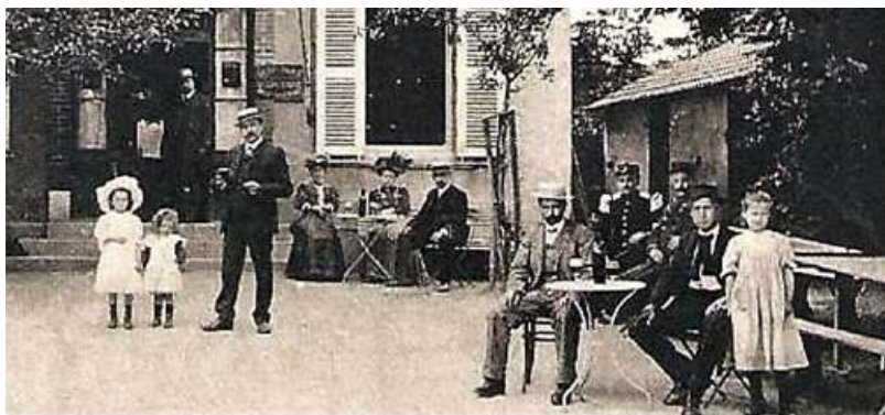
Détail des personnages. A droite, la buanderie avec le chalet de nécessité

Sur la façade, il est porté les mentions "Café -Restaurant". Mais jusqu'à la première guerre mondiale, l'établissement était aussi un hôtel, ainsi que le révèle l'en-tête de commerce ci-jointe.