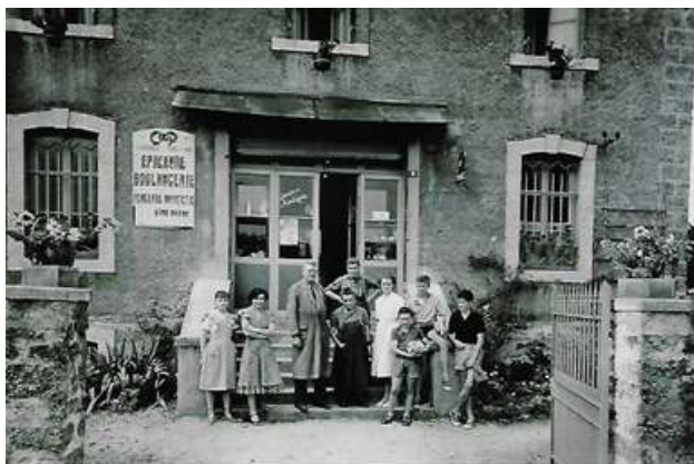
La Coop en 1955 ...