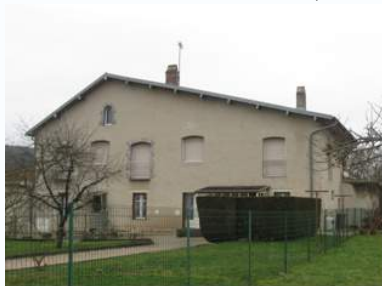
De la ferme de Roche ...

La devise d'une bonne femme de chambre : « On voit tout, on entend tout, mais on ne dit rien ! » En somme, une vie riche d'expériences aux facettes multiples.