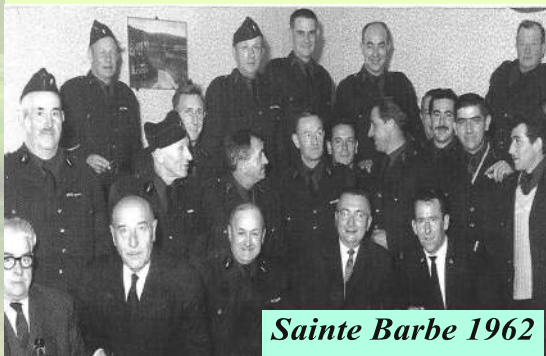
Sainte Barbe 1962

Selon les enquêteurs, l'incendie serait d'origine criminelle, le grillage de protection entourant la cuve détruite ayant été cisailé en deux endroits.